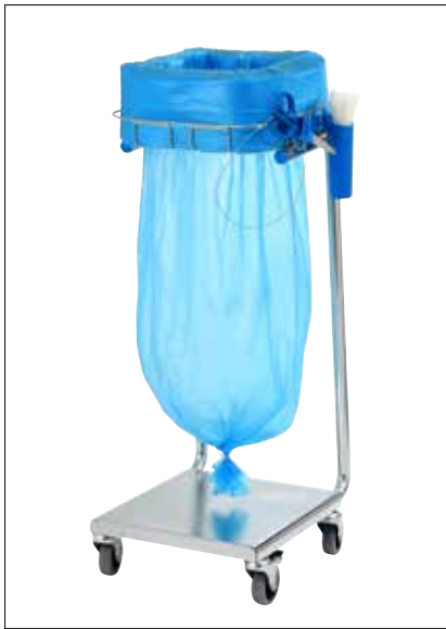
Stand Dynamic Mini/Mini Pedal