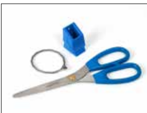
Kit de tijeras para Longopac Stand Dynamic, de material detectable de metal Item no. 34609 Kit que contiene unas tijeras de material detectable de metal, el soporte para las tijeras y alambre de acero inoxidable.