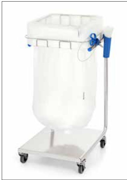
Stand Dynamic Midi/Midi Pedal