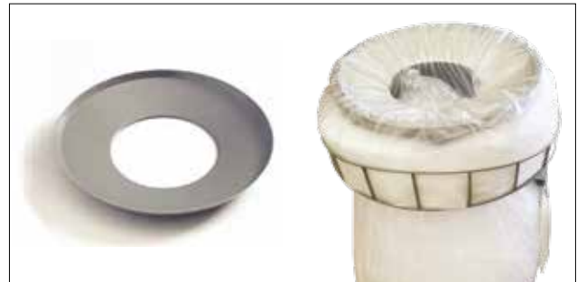
Placa reductora de agujero para Longopac Stand Classic Maxi Item no. 30170 Reduce la abertura de introducción, lo que facilita la compresión de, por ejemplo, plástico retornable. Solo está disponible para el modelo Maxi.