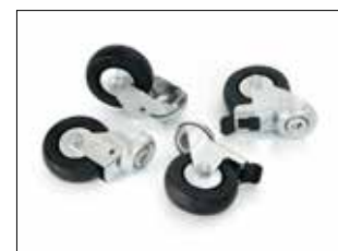
Kit de ruedas ESD para Longopac Stand Dynamic Item no. 34616 Incluye cuatro ruedas giratorias, dos de ellas con frenos. Reemplaza las ruedas originales en los soportes utilizados en áreas restringidas de ESD.