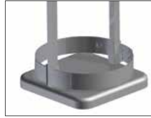
Marco para Longopac Stand Classic Maxi Item no. 33900 El marco mantiene la bolsa en su sitio.