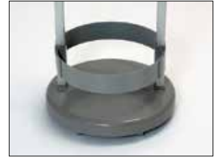
Marco para Longopac Stand Classic Mini Item no. 33890 El marco mantiene la bolsa en su sitio.