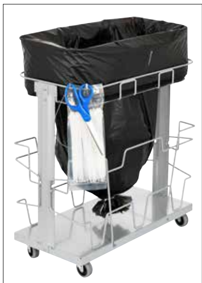
Stand Dynamic UBS