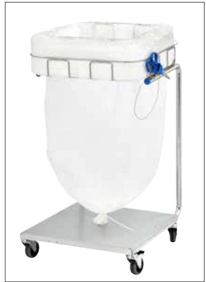
Stand Dynamic Maxi/Maxi Pedal