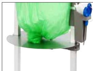
Placa ajustable para Stand Classic Mini Item no. 31480 Reduce el consumo de material de las bolsas y el tamaño de las mismas. Destinado principalmente a residuos pegajosos y pesados. Se puede utilizar perfectamente para bobinas de bolsas biodegradables.